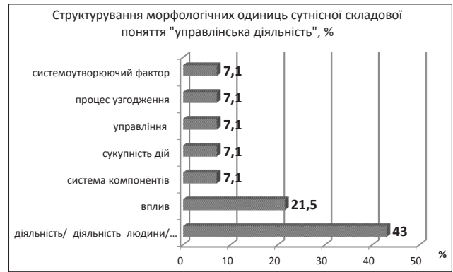
Рис. 2. Структурування морфологічних одиниць сутнісної складової поняття «управлінська діяльність»

Як видно з рисунку, більшість науковців управлінську діяльність характеризують як діяльність суб'єкта, які здійснюють вплив на керовану систему, або управління іншими суб'єктами або об'єктами. На другому місці за частотою використання має така характеристика, як вплив. Але діяльність, як зазначено вище і є вплив. А управління, як одне з використовуваних морфологічних одиниць в визначенні поняття, характеризується як практична діяльність, яка здійснює цілеспрямований вплив і так далі. Все це вказує на те, що не зважаючи на частоту використання тієї чи іншої морфологічної одиниці, науковці, використовуючи певну морфологічну одиницю сутнісної складової при визначенні даного поняття, мають загальне смислове значення поняття.