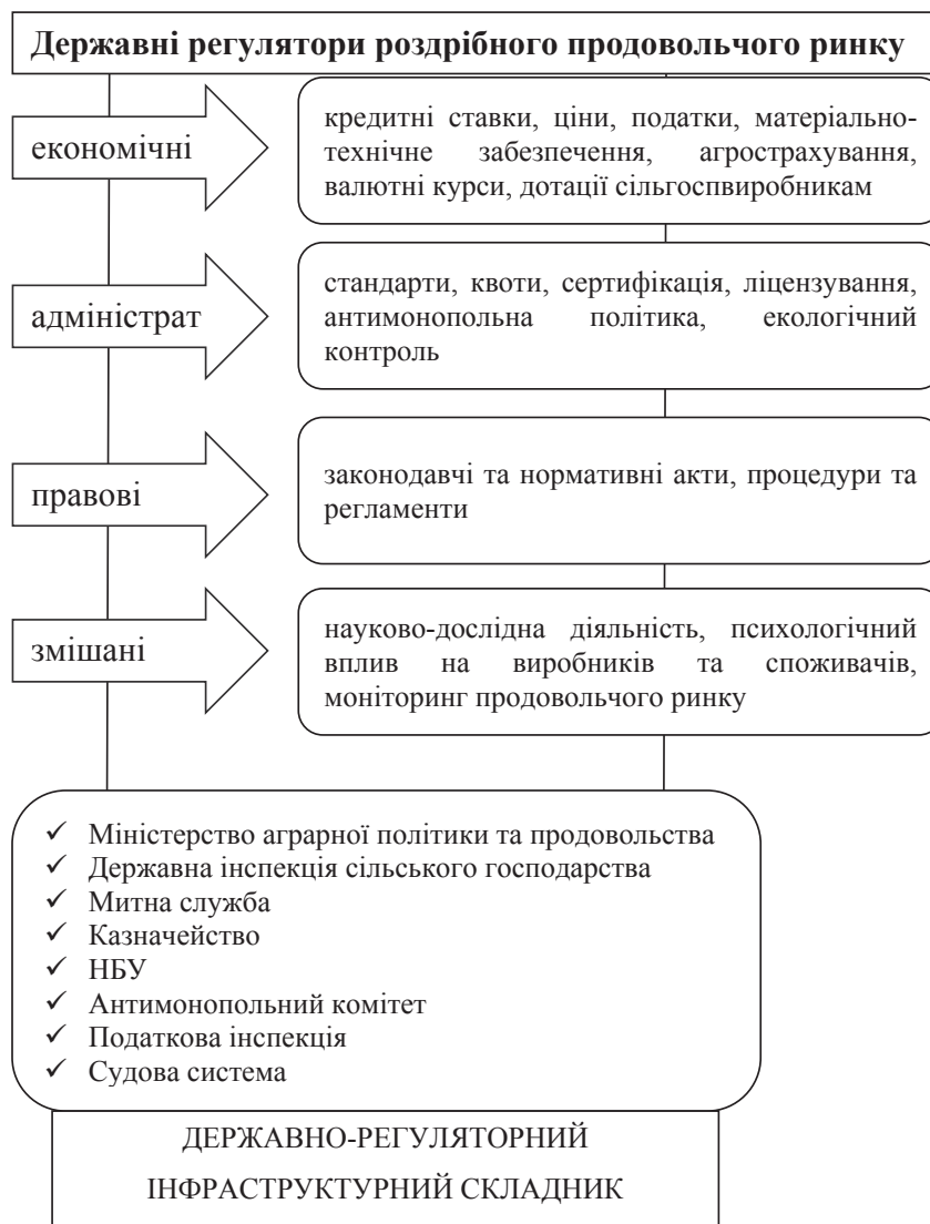
Рис. 5. Державні регулятори продовольчого ринку України