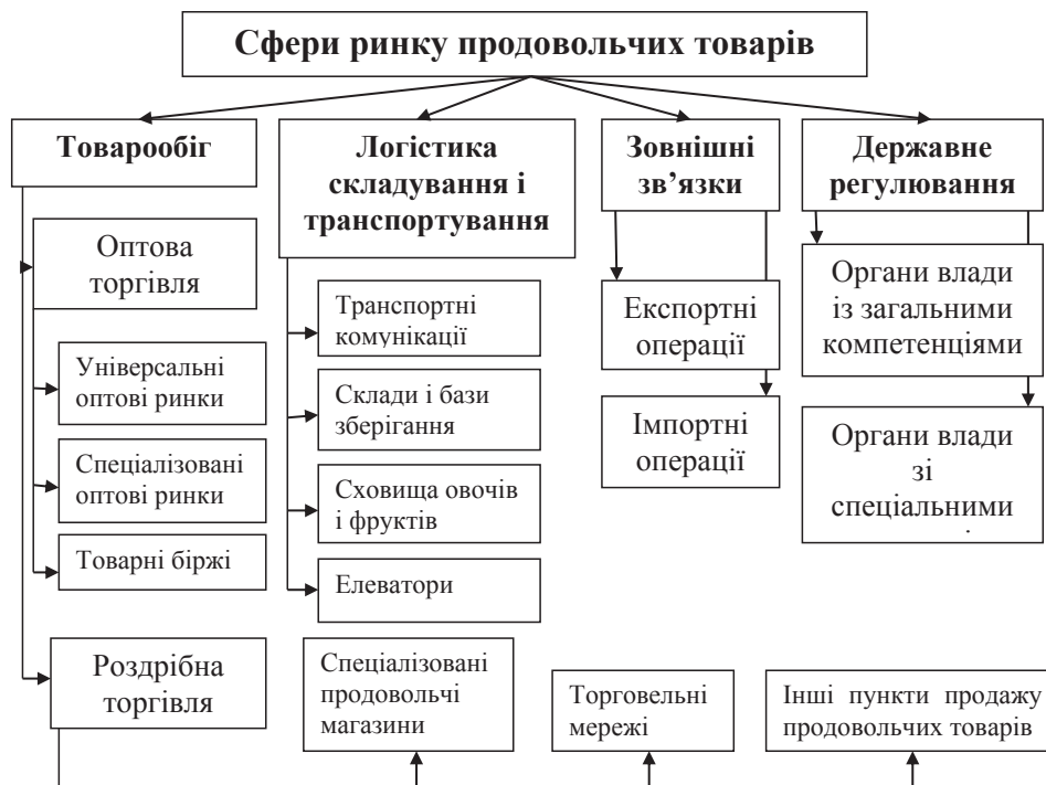
Рис. 1. Сфери ринку продовольчих товарів