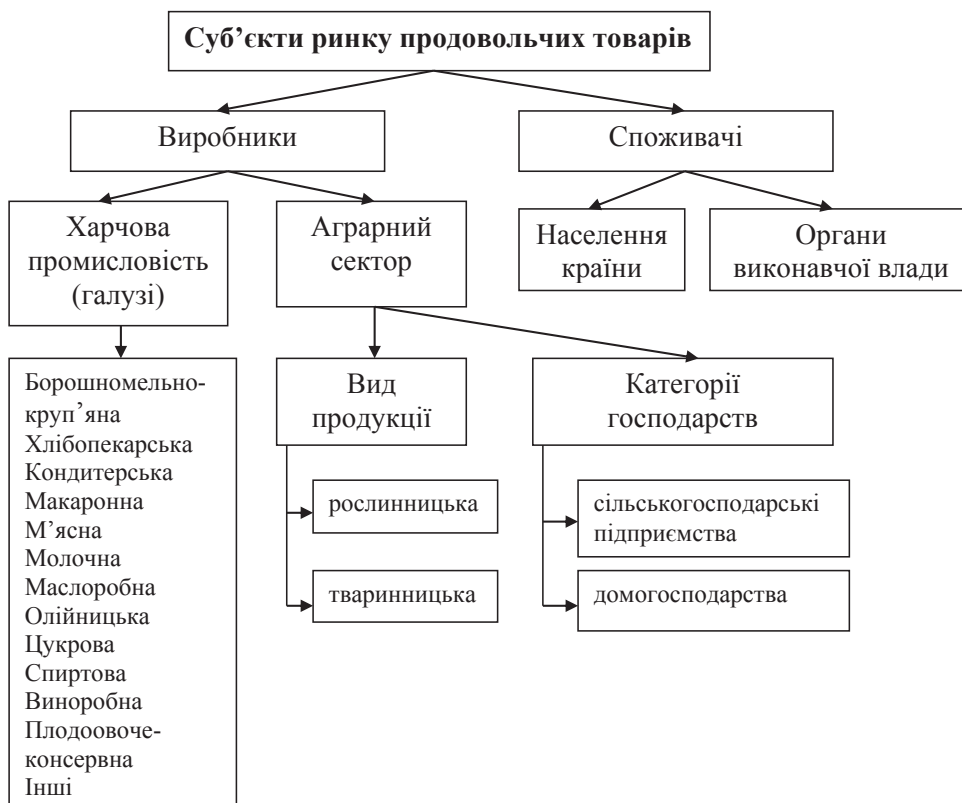
Рис. 2. Суб'єкти ринку продовольчих товарів