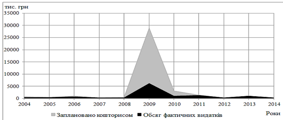
Рис. 2. Фінансове забезпечення однорічних природоохоронних заходів з обласного фонду охорони навколишнього природного середовища в 2004–2014 рр.

Впродовж 2004–2015 рр. на території Львівської області було профінансовано 137 природоохоронних заходів щодо впорядкування та охорони природно-заповідного фонду. Найінтенсивніше кошти виділяли в період 2008–2011 рр. (табл. 2) на запобігання знищенню чи пошкодженню природних комплексів природно-заповідного фонду – 7 934,5 тис. грн., облаштування, упорядкування та реконструкцію існуючих та розробку проектів організації нових територій та об'єктів природно-заповідного фонду – 1 044,0 тис. грн., збереження та відтворення рідкісних та зникаючих видів флори та фауни – 2 463,8 тис. грн., а також на винесення в натуру меж і виготовлення охоронно-межових знаків територій та об'єктів природно-заповідного фонду 1 180,9 тис. грн. Можна стверджувати, що збіль-