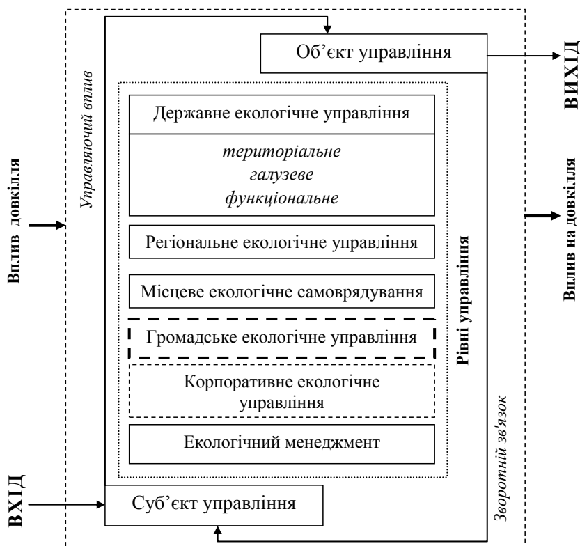
Рис. 1. Основні рівні системи екологічного управління

При цьому серед представників наукової спільноти існують різні підходи до розуміння сутності екологічного управління. Зокрема В. Шевчук [3] визначає екологічне управління як системну складову загальної системи управління, що має за мету здійснення екологічної політики й досягнення екологічних цілей та яка містить організаційну структуру, діяльність із