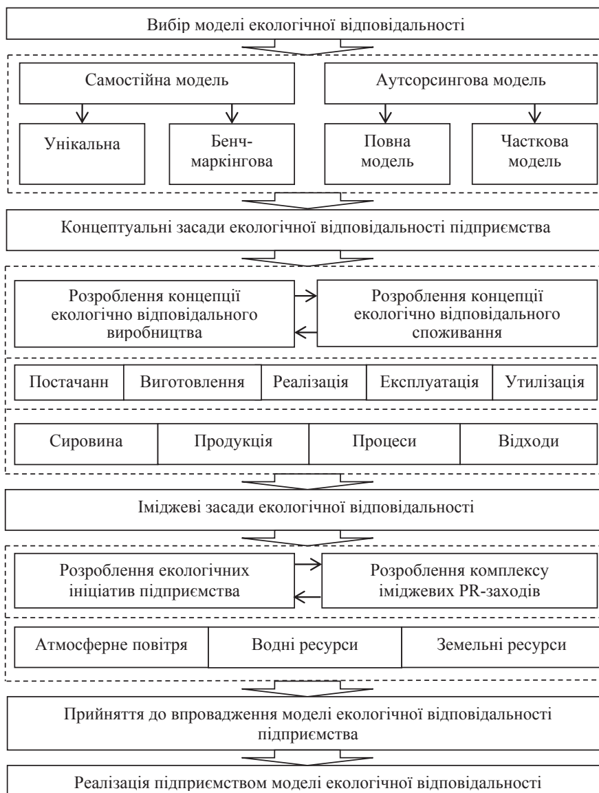
Рис. 2. Процес упровадження у життя моделі екологічної відповідальності підприємства

Передбачається вибір моделі екологічної відповідальності, яка би повною мірою враховувала специфіку функціонування підприємства та була б зорієнтована на перехід до системного вирішення екологічних проблем, що є особливо важливим для українських підприємств.