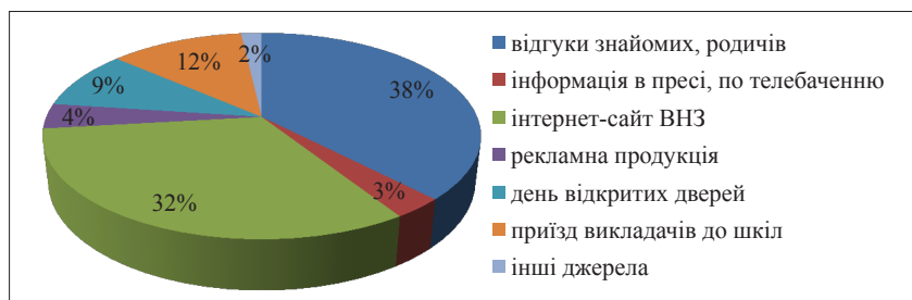
Рис. 1. Рейтинг джерел інформації про ВНЗ