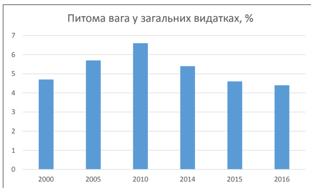
Рис. 3. Питома вага витрат на вищу освіту в структурі видатків зведеного бюджету