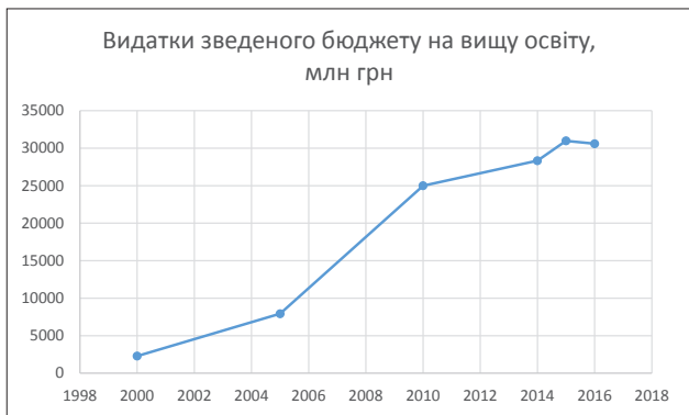
Рис. 2. Видатки зведеного бюджету на вищу освіту