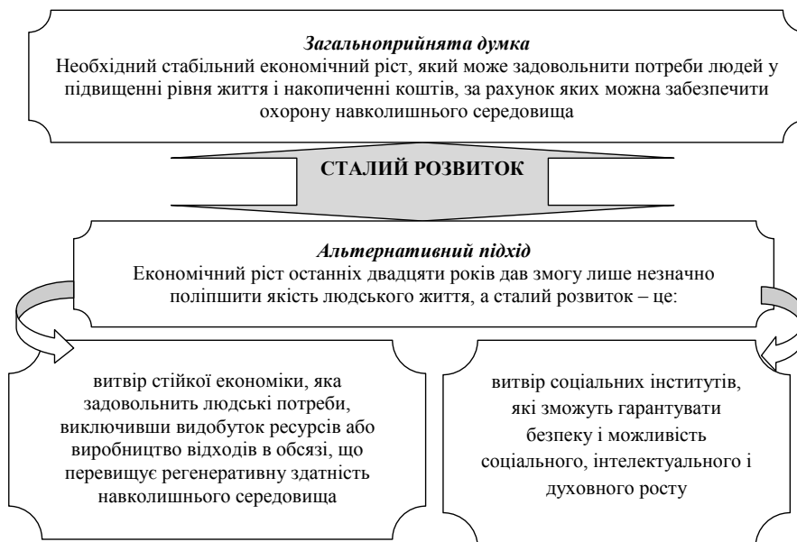
Рис. 2. Стандартне та альтернативне розуміння категорії «сталий розвиток»

Девід К. Кортен підкреслює розбіжності між стандартним і альтернативним розумінням сталого розвитку (рис. 2). Більшість економістів, урядів і офіційних агенцій (включаючи Міжнародний валютний фонд, Всесвітній банк і Міжнародну угоду з тарифів і торгівлі), які визначають національну і глобальну політику, демонструють стандартне розуміння категорії. Велике число «альтернативних» економістів,