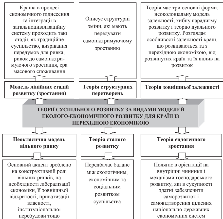
Рис. 1. Характеристика теорій суспільного розвитку за видами моделей еколого-економічного розвитку для країн з перехідною економікою

Теорія сталого розвитку передбачає баланс між екологічним, економічним та соціальним розвитком суспільства. Концепція сталого розвитку сьогодні набуває все більшої актуальності і для України, необхідним стає перехід від стереотипного бачення до новітніх форм ведення бізнесу та функціонування окремих сфер економіки, зокрема агросфери. Провідною ідеєю концепції сталого розвитку є забезпечення високого рівня життя, що передбачає гармонійний розвиток екологічної і соціально-економічної сфер [8]. У процесі дослідження вивчено еволюцію підходів світової спільноти до проблематики сталого розвитку, яка дає змогу зрозуміти масштабність і без-