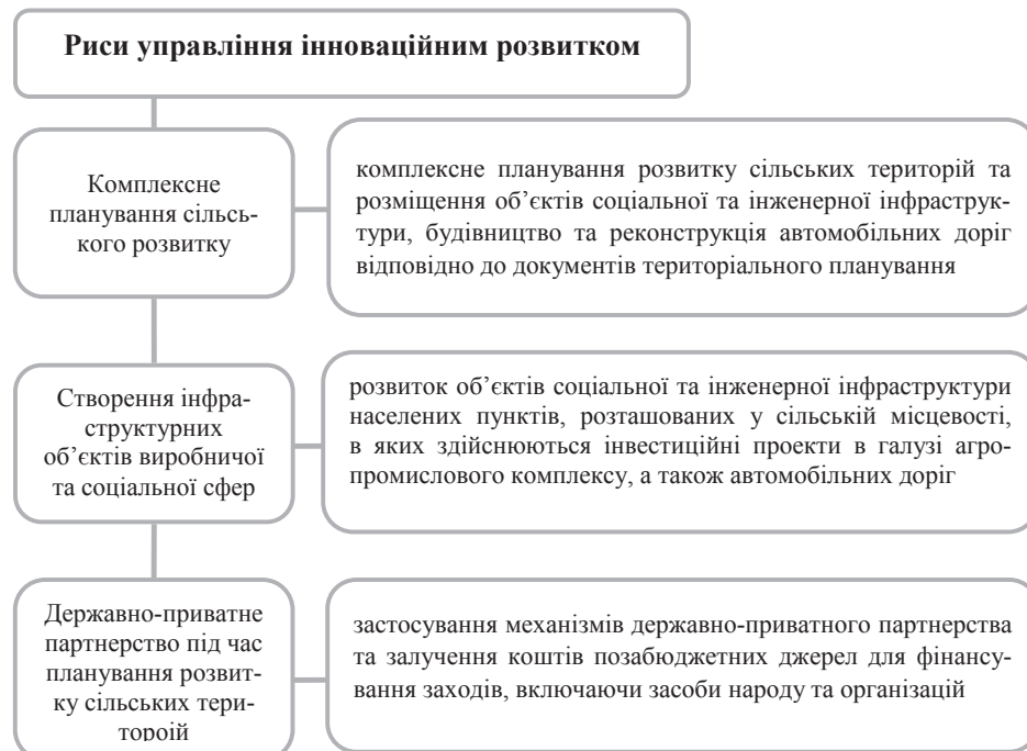
Рис. 1. Складові риси управління інноваційним розвитком сільських територій