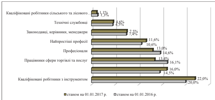
Рис. 2. Структура вакансій за професійними групами