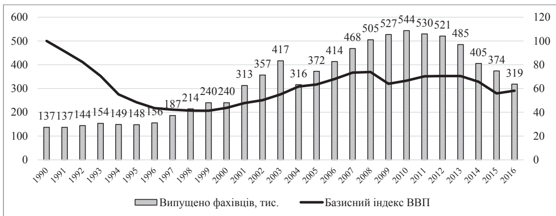
Рис. 3. Зіставлення випуску ЗВО та динаміки ВВП в Україні

6. Важливим викликом для системи освіти у сучасних умовах є забезпечення ефективного взаємодії між університетами та реальним сектором економіки . У цій взаємодії вища освіта майже традиційно зазнає критики та виступає ініціатором, пропозиції якого залишаються без відповіді. З іншого боку, склалася ситуація, коли 30% українців відчувають,