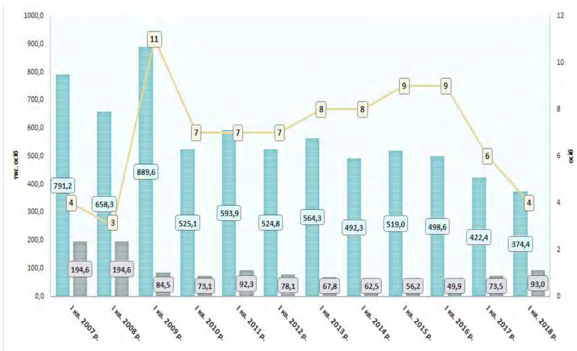
Рис. 2. Динаміка попиту і пропозиції робочої сили в Україні