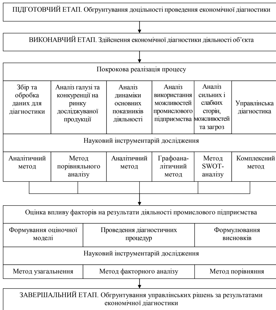
Рис. 1. Методика проведення економічної діагностики діяльності промислового підприємства